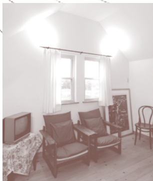
ドライウォール施工事例

室内の壁は、全て北米と同じドライウォール（塗り壁）仕上げ。 カナダ製の間接照明を当てると、そこはお洒落なカフェを思わせます。 室内に使われる塗料もカナダの水溶性塗料（PARAペイント）を使っているため、 アレルギー体質の方でも安心で、いやな臭いもありません。