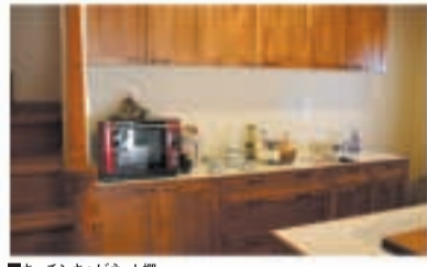
■キッチンキャビネット

安全性へのこだわり、内装材は無垢材使用 内装材は安全性と耐久性のある無垢材を使用。床は20mm、階段は40mm厚のバイン材を使用しています。塗装も化学薬品やウレタン塗料ではなくドイツ製天然オイル塗料を使用。室内は塩ビ・クロスやホルムアルデヒドを含む接着剤は使いません。