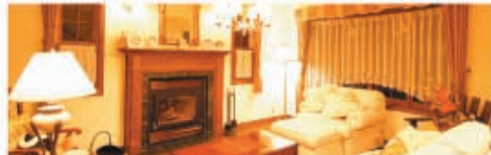
暖炉のあるリビング