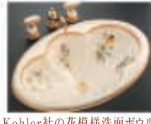
Kohler社の花模様洗面ボウル