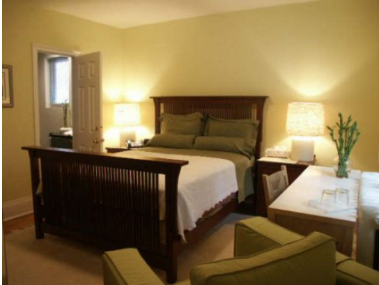
<宿泊予定のB&Bのお部屋>